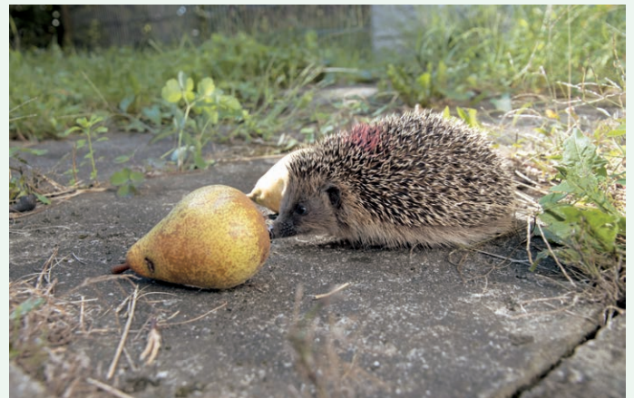
Jungigel sucht nach Insektennahrung im Fallobst

Unsere fünf «Igelmütter» aus den Kantonen AG, LU, BE und VS haben insgesamt 1'489 Igelpatienten, davon 930 ausgewachsene Igel und 559 Jungigel, aufgenommen, tiermedizinisch versorgt, gepflegt und aufgepäppelt. Noch vor der nahrungslosen Winterzeit konnten 1'123 Igel gesund gepflegt und ausgewildert werden.