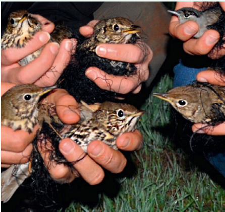
Gerettete Singdrosseln und Mönchsgrasmücke

Jährlich töten Vogeljäger und Vogelwilderer in Südeuropa weiterhin bis zu 20 Millionen in der EU streng geschützte Zugvögel. Besonders im Süden Europas wurden durch das Corona-bedingte Ausbleiben der Vogelschützer in den Vogelschutz-Camps, wieder vermehrt Drosseln, Ortolane, Lerchen, Grasmücken, Nachtigallen und Rotkehlchen skrupellos gejagt und auf tierquälerische Art und Weise gefangen und getötet. Auch der Abschuss von Weidensperlingen, Bienenfressern oder Falkenarten hat 2020 wieder zugenommen.