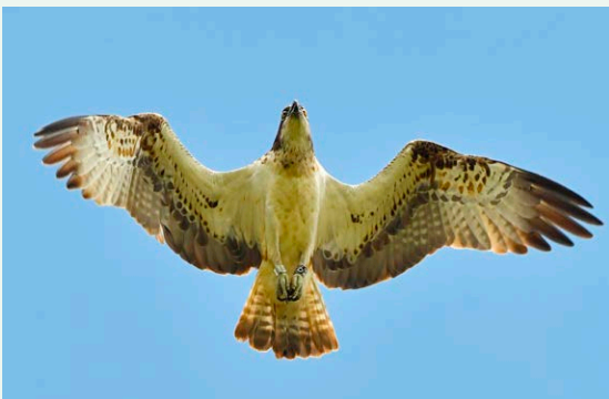
Elternvogel in Deutschland von Fischadler-Küken Zeppelin (Ring F26) aus Aufzucht 2020 in der Schweiz

zurück, um sich zu verpaaren und zu brüten. Taurus signalisierte seine Freude über die jungen 2020 er Artgenossen deutlich und brachte täglich Fisch für die Jungadler, den er im Drei-Seen-Land für sie fing. Ein klares Zeichen, dass er bereit ist für seine Rolle als Fischadlervater, wenn er denn nur ein Weibchen findet. Im Jahre 2020 hatte er leider noch keinen Erfolg und ist am 4. September wieder unverpaart Richtung Afrika aufgebrochen.