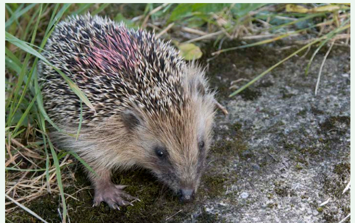
Gesund gepflegter Jungigel erkundet den Garten der Rettungsstation