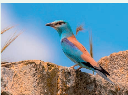
Blauracke