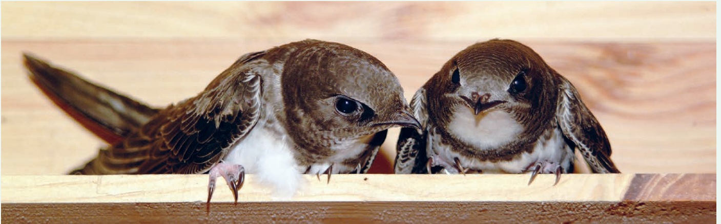
Junge Alpensegler erholen sich in der von uns massgeblich geförderten Rettungsstation in Rümlang/ZH

Alpen- und Mauerseglerexpertin Silvia Volpi engagiert sich seit über 20 Jahren für den Schutz und die Pflege von Seglern in akuter Not und betreibt und führt seit 18 Jahren im Zürcher Unterland in Rümlang die grösste und erfahrenste Mauer- und Alpensegler-Rettungs- und Auswilderungsstation der Schweiz.