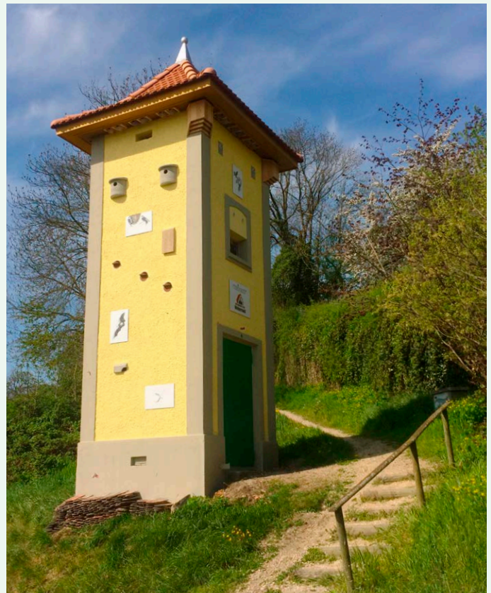
Fertiggestellter Artenschutzturm: Seit Frühjahr 2020 hat die Gemeinde Walperswil/BE eine neue Zuflucht für ihre tierischen Mitbewohner

Der Turm in Walperswil hat für Gebäude bewohnende Tierarten einen besonderen Wert, da der Standort am Übergang des Siedlungsgebiets zur offenen Kulturlandschaft liegt. Diese Lage bietet Fördermöglichkeiten für typische Siedlungsvögel wie Hausperling, Hausrotschwanz und Bachstelze aber auch für typische Kulturlandvögel wie Turmfalke, Schleiereule, Feldsperling und Star. Auch die Förderung der Fledermäuse ist uns wichtig und wir haben entsprechende Unterschlupfmöglichkeiten und einen Zugang in den Dachstuhl geschaffen, sind doch mehr als \frac{2}{3} aller Fledermausarten in der Schweiz gefährdet bis stark bedroht.